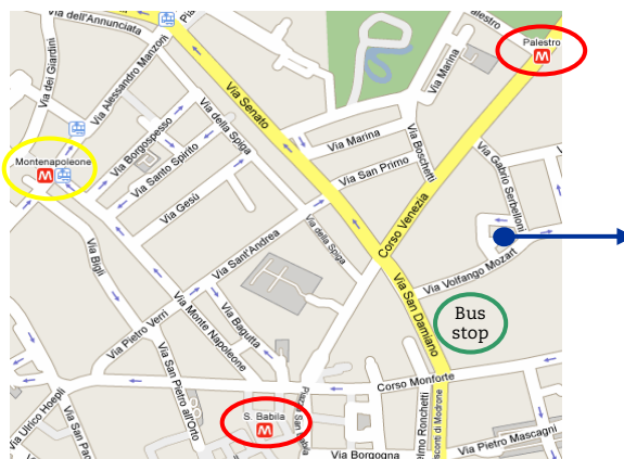
Villa Necchi Campiglio